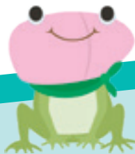
肝疾患センターキャラクター 肝ガエル君